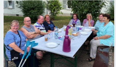
Esslingen Zollberg und Sindelfingen, FLÜWO-MOBIL unterwegs im Quartier, Nachbarschaftstreff

Wir danken allen, die dabei waren und freuen uns schon riesig auf die nächsten Termine mit unserem rollenden Nachbarschaftstreff, dem FLÜWO-MOBIL! ●