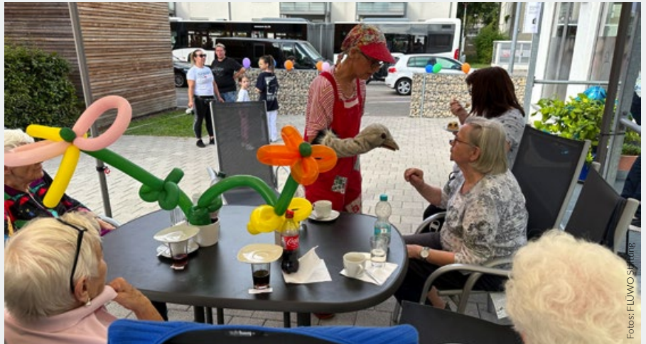
Esslingen Pliensauvorstadt, Nachbarschaftstreff Vorstadt, Jubiläumsfeier

Die FLÜWO Stiftung und das Team des Nachbarschaftstreffs bedanken sich bei