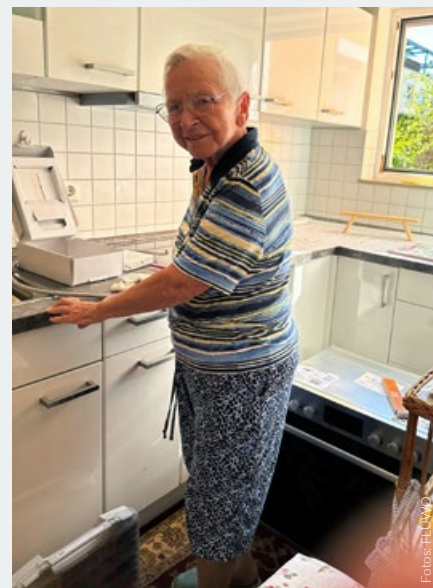
Ostfildern, FLÜWO-Mieterin, Installation eines Herdwächters