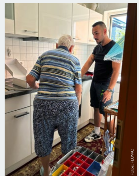
Ostfildern, FLÜWO-Mieterin, Installation eines Herdwächters